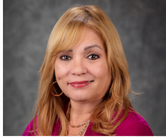
Comisionada del Distrito 4 La Honorable Maribel Gomez Cordero